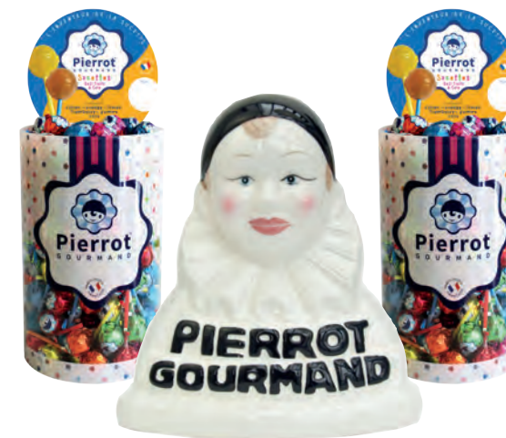
Colis sucettes boules Pierrot Gourmand

Réf. 0151 - 250x13g - Tubo cristal Tarif : ligne 240