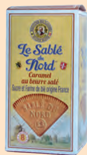
Sablé du Nord au caramel