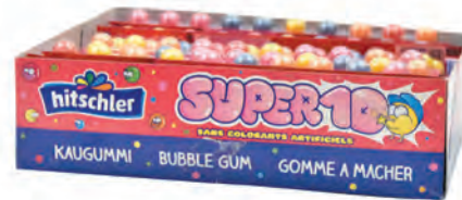
Super 10 ♦ ♦ Réf. HI1063 ♦ 48x20g - Boite carton ♦ Tarif : ligne 176