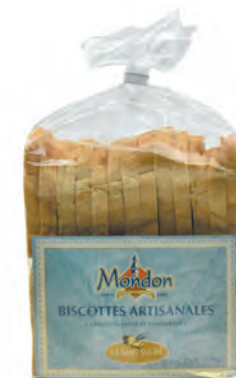
Biscottes « sans sucre »

◆ Réf. 04001002 ◆ 6x370g - Sachet ◆ Tarif : ligne 291