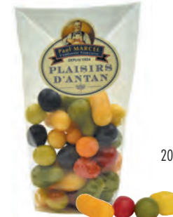
Petits fruits Paul Marcel

◆ ◆ ◆ Réf. 13317112 20x200g - Sachet pâtissier Tarif : ligne 25