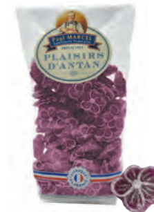
Violettes Paul Marcel

◆ ◆ ◆ Réf. 13317109 20x200g - Sachet pâtissier Tarif : ligne 20