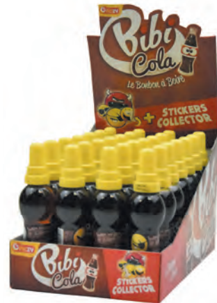
Bibi cola ♦ ♦ Réf. FI1046 ♦ 28x168g - Présentoir ♦ Tarif : ligne 174