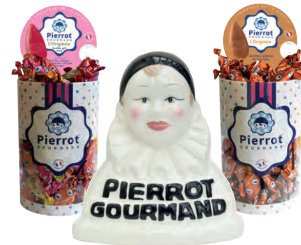
Colis sucettes plates Pierrot Gourmand