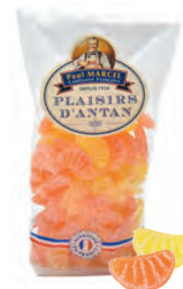
Tranches orange-citron Paul Marcel

◆ ◆ ◆ Réf. 13317127 20x200g - Sachet pâtissier Tarif : ligne 22