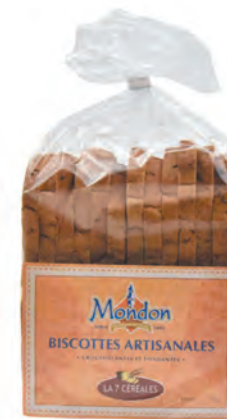
Biscottes « 7 céréales »

◆ Réf. 04001001 ◆ 6x370g - Sachet ◆ Tarif : ligne 290