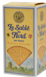
Sablé du Nord

Réf. 05904495 24x40g - Présentoir/étui Tarif : ligne 249