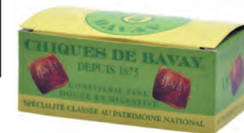
Chiques de Bavay

◆ ◆ ◆ Réf. 03903002 16x100g - Coffret cartont Tarif : ligne 110