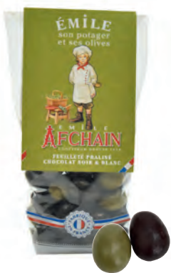
Émile son potager et ses olives

Nougatine aux amandes et graines de tournesol enrobée de chocolat blanc