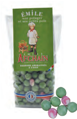
Émile son potager et ses petits pois

Cœufs feuilletés au chocolat noir et blanc