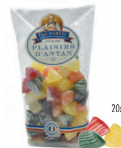
Berlingots Paul Marcel

◆ ◆ ◆ Réf. 13317109 20x200g - Sachet pâtissier Tarif : ligne 20