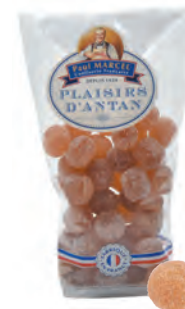
Boules miel Paul Marcel

◆ ◆ ◆ Réf. 13317743 20x200g - Sachet pâtissier Tarif : ligne 24