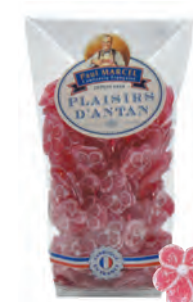
Coquelicots Paul Marcel

◆ ◆ ◆ Réf. 13317126 20x200g - Sachet pâtissier Tarif : ligne 21