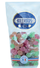
Perles bienfaisantes Killtoïds

Réf. 13316206 20x50g - Sachet pâtissier Tarif : ligne 41