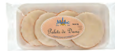
Grands Palets de Dame

◆ Réf. M07020 ◆ 12x140g - Barquette ◆ Tarif : ligne 289