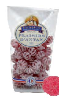
Framboises Paul Marcel

◆ ◆ ◆ Réf. 13317724 20x200g - Sachet pâtissier Tarif : ligne 23