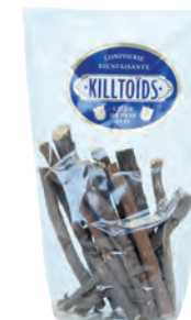
Bois de réglisse Killtoïds

Réf. 13460201 20x200g - Sachet pâtissier Tarif : ligne 40