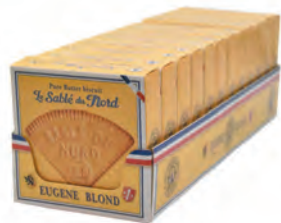
Sablé du Nord