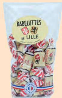
NOUVEAU Babeluttes de Lille

◆ ◆ ◆ Réf. 06103108 20x150g - Sachet pâtissier Tarif : ligne 3