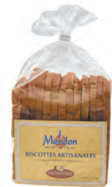
Biscottes « authentiques »

◆ Réf. M07020 ◆ 12x140g - Barquette ◆ Tarif : ligne 289