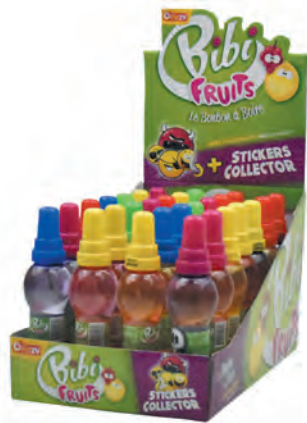
Bibi fruits ♦ ♦ Réf. FI1329 ♦ 28x168g - Présentoir ♦ Tarif : ligne 173