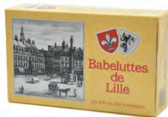
Babeluttes de Lille

◆ ◆ ◆ Réf. 06103108 20x150g - Sachet pâtissier Tarif : ligne 3