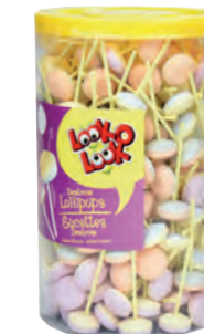
♦ ♦ ♦ ♦ Réf. 302330 ♦ 500x1,25g - Tubo cristal ♦ Tarif : ligne 180