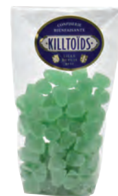
Boules molles Killtoïds

Réf. 06290400 24x12g - Présentoir/boîte fer Tarif : ligne 114