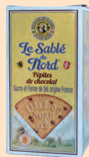
Sablé du Nord aux pépites de chocolat

Réf. 05904490 12x165g - Présentoir/étui Tarif : ligne 251