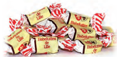
Babeluttes de Lille

◆ ◆ ◆ Réf. 06103111 8x300g - Boite fer Tarif : ligne 108