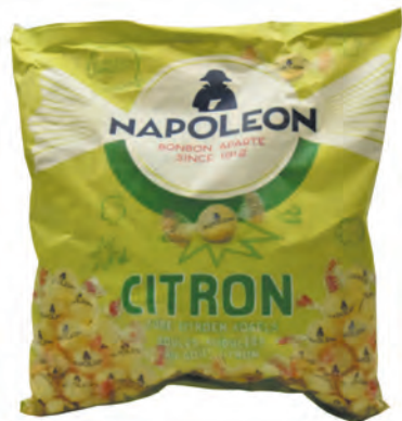
Napoléon ♦ ♦ Réf. NA3701 ♦ 3x1000g - Sachet ♦ Tarif : ligne 175