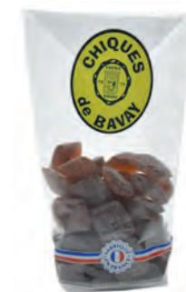
Chiques de Bavay

◆ ◆ ◆ Réf. 06103118 1x5000g - Vrac Tarif : ligne 109