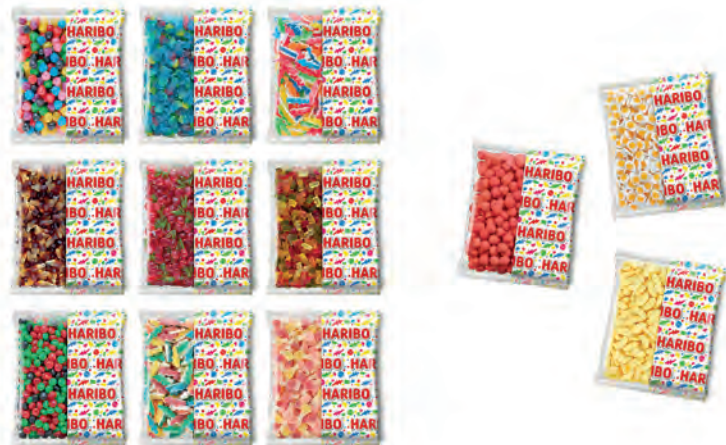
Haribo Colis 9 + 3