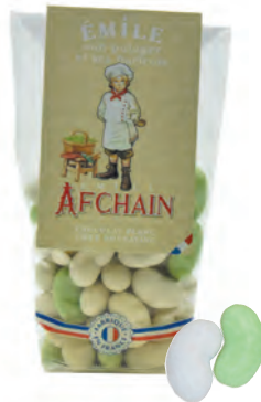
Émile son potager et ses haricots

Confiserie avec un cœur nougatine enrobé de chocolat blanc