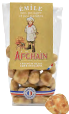
Émile son potager et ses patates

◆ Réf. 13317107 ◆ 20x200g - Sachet pâtissier ◆ Tarif : ligne 16