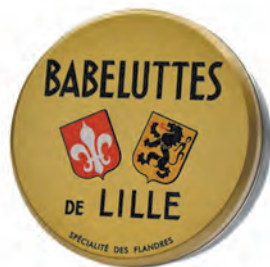
Babeluttes de Lille

◆ ◆ ◆ Réf. 06103109 10x250g - Coffret carton Tarif : ligne 107